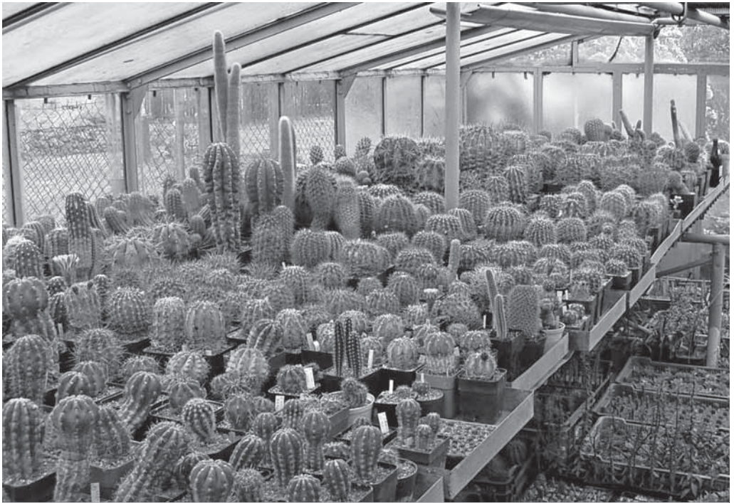
Pohled do sbírky Zdeňka Červinka – v popředí oblíbené rostliny rodu Echinopsis