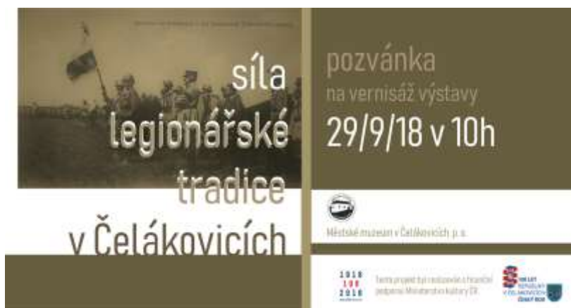
Pozvánka na výstavu