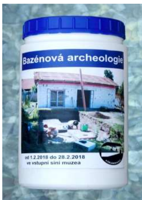
Plakát na výstavu