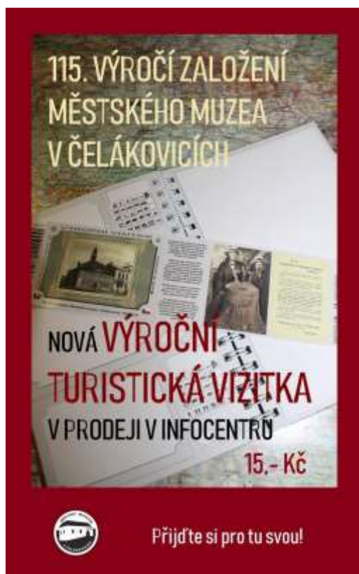
Upoutávka na suvenýr k 115. výročí založení muzea, září 2018