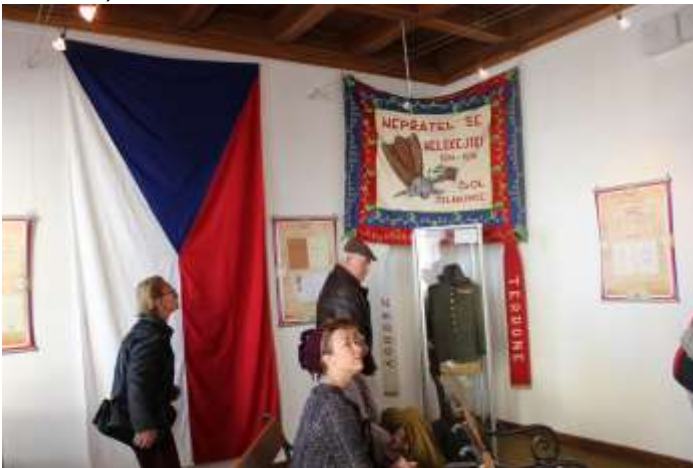
Foto ze zahájení výstavy Síla legionářské tradice v Čelákovicích, 29. 9. 2018