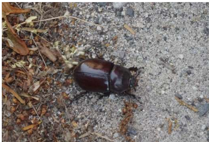
Pozorovaný nosorožík kapucínek ( Oryctes nasicornis), 7. 6. 2018