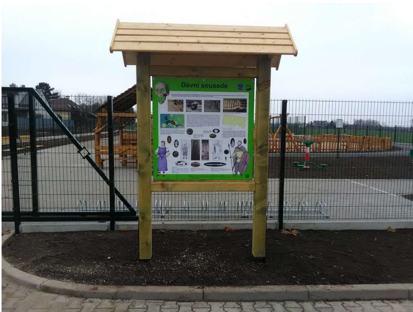
Tabule Dávni sousedé v Záluží po instalaci, 27. 11. 2018