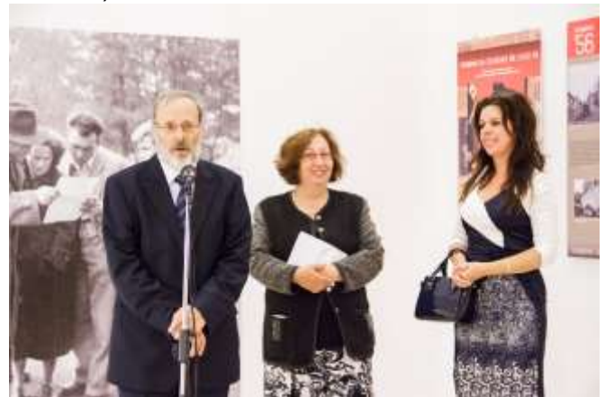
Foto ze zahájení maďarské verze výstavy Tatabánya '56 - Čelákovice '68 - Levice '68 v Tatabányi koncem roku 2018, zdroj: Tatabánya MJV Tatabányai Múzeum