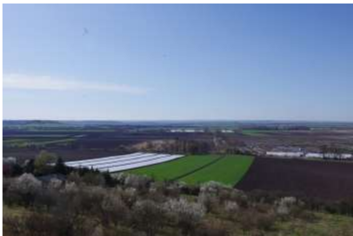
Pohled z Přerovské hůry, 10. 4. 2018