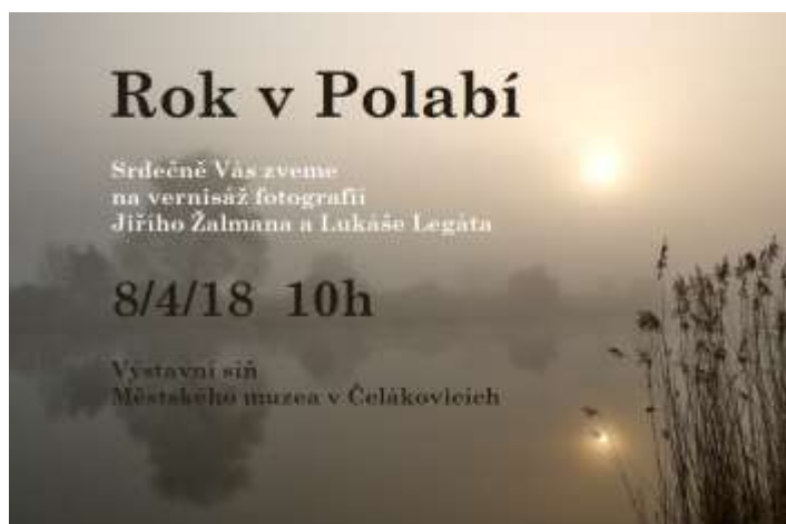
Pozvánka na výstavu