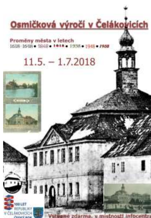
Plakát na výstavu