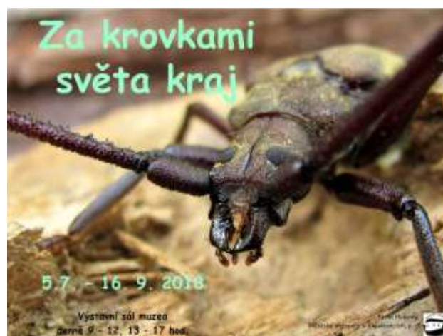
Plakát na výstavu